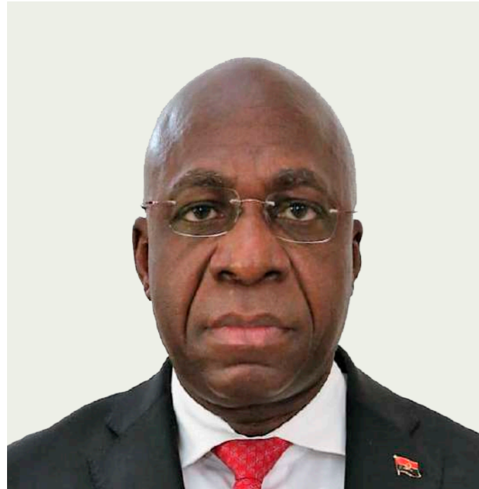
S.E. Tête António Ministro das Relações Exteriores

A diplomacia angolana comemorou no dia 12 de Novembro o Dia do Diplomata Angolano, facto que honra com satisfação os quadros nacionais que ao longo dos anos, estiveram comprometidos e engajados na prossecução dos objectivos estratégicos da política externa da República de Angola.