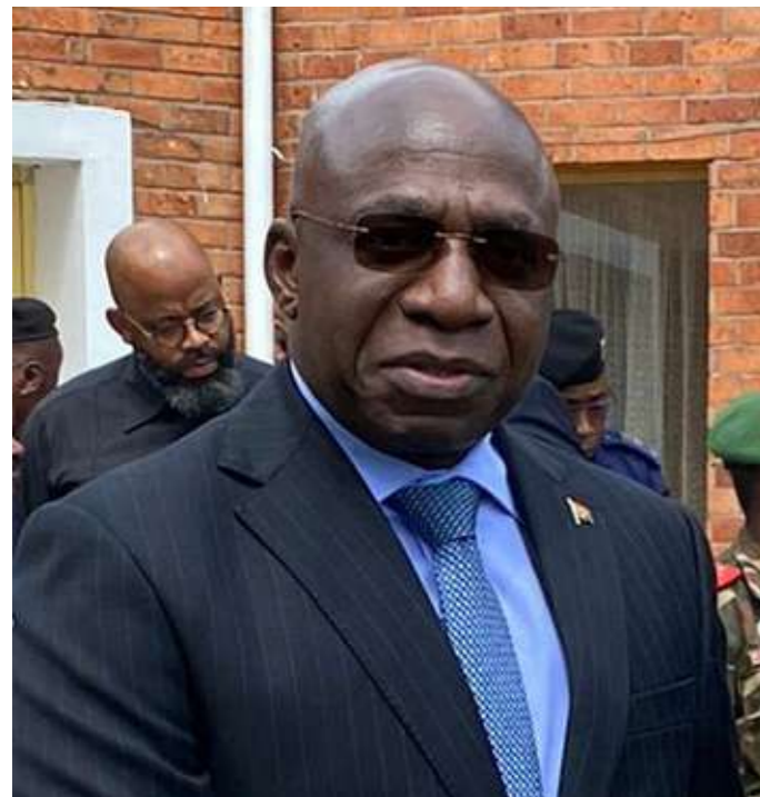
S.E Tête António Ministro das Relações Exteriores

Aos 06 de Julho passado, em Luanda , os três Chefes de Estado , acordaram um césar-fogo imediato e a criação de um Mecanismo de Observação Ad-Hoc , liderado, doravante, pelo Tenente-General Nassone João .