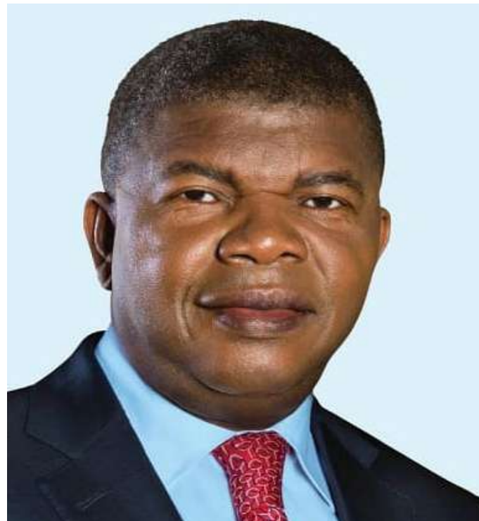
S.E. João Manuel Gonçalves Lourenço Presidente da República de Angola

A s cidades de Kigali e de Kinshasa , capitais do Ruanda e da RDC , respectivamente, receberam nos dias 11 e 12 de Novembro , a visita de Sua Excelência João Manuel Gonçalves Lourenço , Presidente da República de Angola, que deslocou-se a esses países no quadro dos esforços diplomáticos empreendidos, como mediador , para remover a tensão prevalecte entre a República do Ruanda e a República Democrática do Congo .