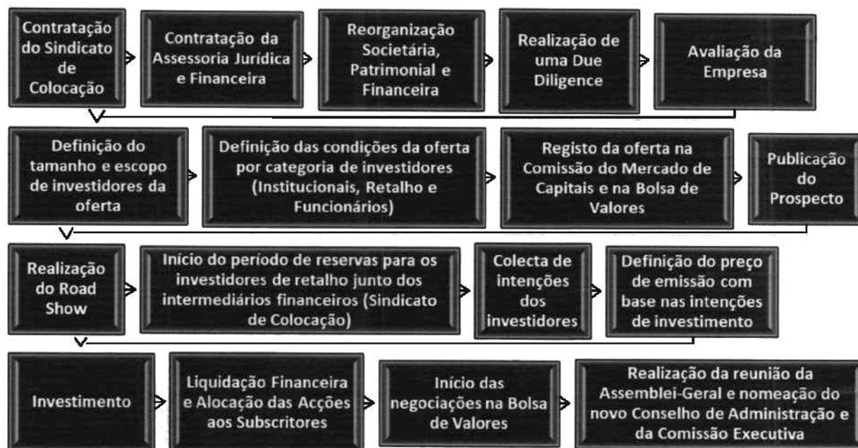
Figura 1 - Roteiro para Oferta Pública Inicial

21. Este procedimento segue o seguinte fluxo 3 :