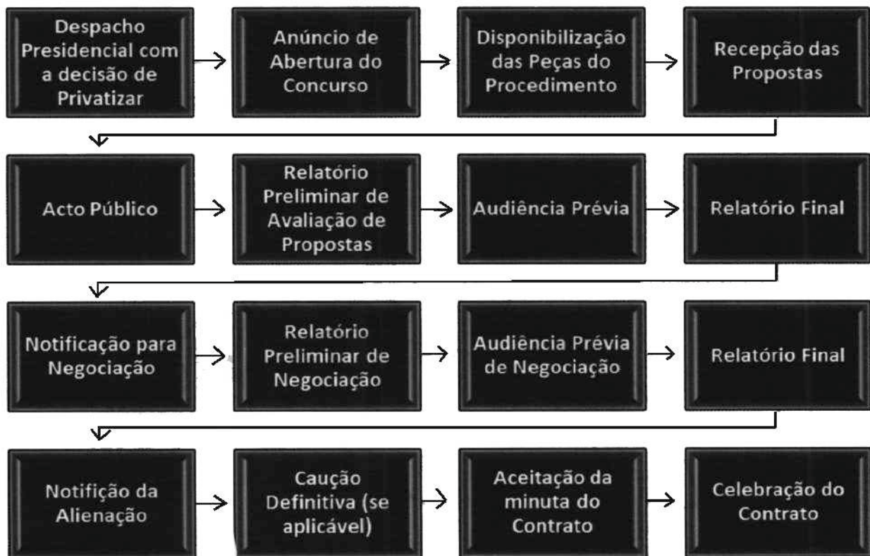
Figura 3 - Roteiro para Concurso Público

23. Este procedimento segue o seguinte fluxo 5 :