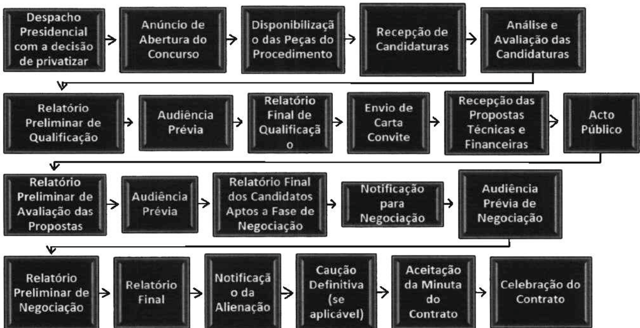
Figura 4 - Roteiro para Concurso Limitado por Prévia Qualificação

24. Este procedimento segue o seguinte fluxo 6 :